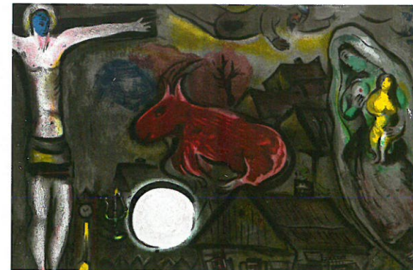
Marc Chagall, 1950, Farblithographie

Ze zběrki Serbskego muzeja se prezentěruju ludowumělske objekty ako n. pš. wupyšnjone jaja z nabóžnymi motiwami. Šichy pětka su w familijach něga jatšowne jaja za kmótsikow pisali a barwili, dokulaž zogolecy žěła su zakazane byli. Šlajchne a žałowanske drastwy jatšownych spiwarkow zwuraznju, kak su se wejsanarki něga tež pó wenkownem na šichy cas pšigótowali.