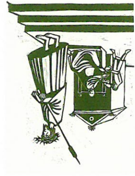
Richard Seewald, 1952

Schauvorführungen Ostereierverzieren in Wachsbalk 1. bis 5. April jeweils 13:00 - 17:00 Uhr mit Mandy Schulz aus Cottbus