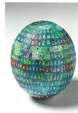
Straubenei Isa Brützke 2011 Bibelzitat aus Markus 16